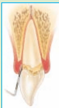
Fig. 1.2 Profundidad de Sondeo para Periodontitis Leve